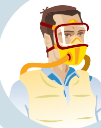
EQUIPO DE RESPIRACIÓN AUTÓNOMO

Para ser efectivos, los equipos respiratorios deben quedar perfectamente ajustados a la cara.