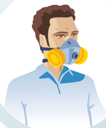
MASCARILLA CON FILTROS