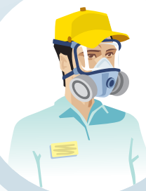
MÁSCARA CON FILTROS